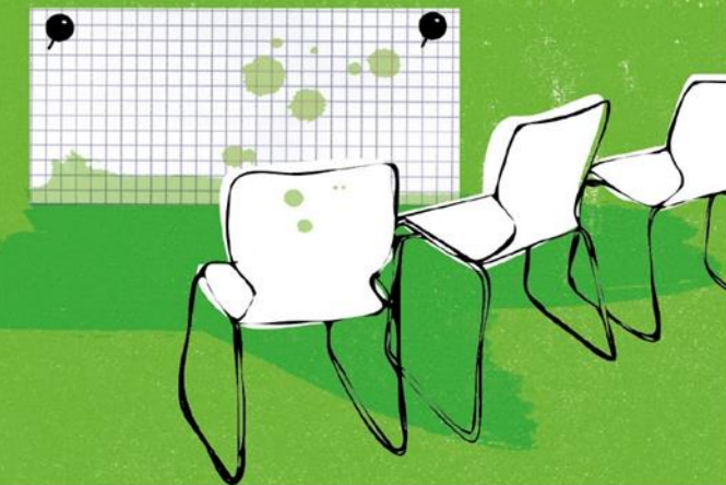
Illustration: © Bente Schipp